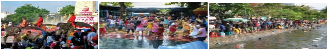
شکل ۷. نمونه موردی، جشنواره سونگگران در ایالت چیانگ مای تایلند