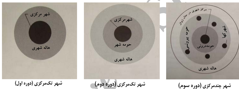
شکل ۱. تغییرات ریخت‌شناسی شهر

ج) دوره سوم از سال ۱۹۷۰ به بعد آغاز می‌گردد و نواحی کلان‌شهری چندمرکزی شکل می‌گیرند. گسترش هسته‌های جمعیتی و شهرک‌های اقماری در پیرامون شهر اصلی و دست‌اندازی توسعه شهری به نواحی پیرامونی از مشخصه‌های این دوره است (ن.ک. شکل ۱).